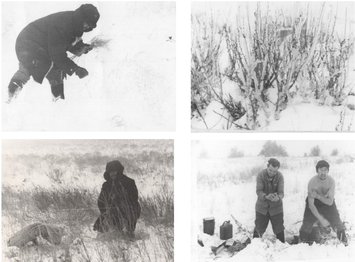
Рис. 4. Во второй половине октября 1976 г. на Северное Прикаспие и Западный Казахстан неожиданно обрушился снежный буран с понижением температуры до минус 10-15°C. Стебли кохии покрылись ледяной коркой.