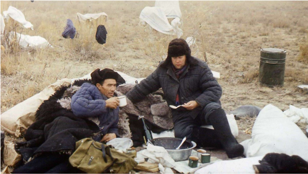
Рис. 5. Сушка в мешках собранных образцов семян кохии и других позднеспелых пустынных кормовых растений во время завтрака. Зап. Казахстан. Казахстанская экспедиция ВИР, 30.10.1975 г.

Материалы диссертации были использованы при издании 2-го тома «Ареалы деревьев и кустарников СССР» (1980), определителей растений Репетекского заповедника (1975) и Туркмении (1980). В 1983 году в картографический фонд отдела геоботаники БИН АН СССР были переданы 24 карты ареалов рода, секций, видов, подвидов и гибридов рода Calligonum , выполненные на бланках с гипсометрической основой масштабом 1:1000000. В коллекции музея БИН АН СССР поступили 66 образцов 14 видов и гибридов древесин, 420 образцов плодов с одревесневшими веточками, 92 образца 12 видов и гибридов пыльцы по роду Calligonum .