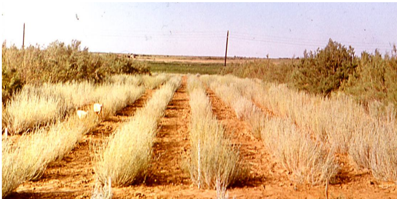
Рис. 3. Питомник образцов кохии простертой Kochia prostrata (L.) Schrad. (сем. Chenopodiaceae ) и других пустынных кормовых растений для северной подзоны пустынь, собранных 3-м отрядом Казахстанской экспедиции ВИР в 1976 г.. Приаральская опытная станция ВИР, 1979 г.

издательства «Флора СССР», наставник по систематике, порекомендовал ему обратить особое внимание именно на этот полиморфный род.