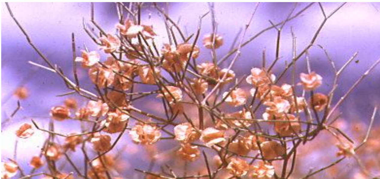
Рис. 2. Жузгун безлистный Calligonum aphyllum (Pall.) Guerke (сем. Polygonaceae ) – кормовой кустарник, лучшее растение для закрепления песков в Северном Прикаспии РФ.

В 1959 году Сосков защищает кандидатскую диссертацию по маральему корню, в которой фактически была представлена монографическая обработка рода Rhaponticum Ludw. В 1960 году прошел по конкурсу в отдел систематики Ботанического института АН Таджикской ССР (г. Сталинабад), который многие годы возглавлял академик П.Н. Овчинников. В течение 7 лет он занимался сбором гербария и таксономической обработкой отдельных родов для «Флоры Таджикской ССР». П.Н. Овчинников и сотрудники гербария выделили для таксономической обработки вновь прибывшему 30-летнему ботанику и наиболее трудный и загадочный род Жузгун ( Calligonum L.), с которым он не расстанется до сего времени (рис. 2).